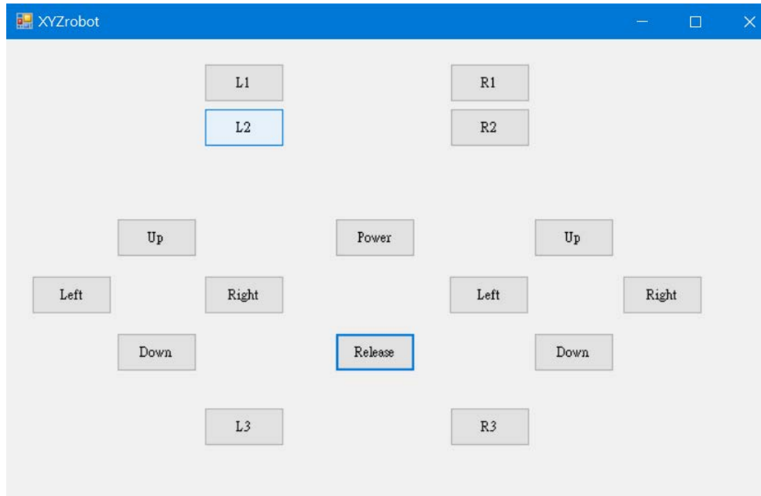
範例程式模擬搖桿介面